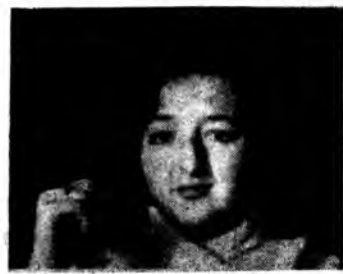
Студентка — педагог

Дзвоніть, пишіть, заходьте: м.Івано-Франківськ, вул.Шевченка, 57, 2-й поверх, каб. 209, 202а, тел.: 9-64-41, 9-64-13;