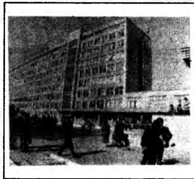
Газета Прикарпатського університету «Педагог Прикарпаття»

Головний редактор Евген Гордич б-9 (133-136) квітень-травень 1993 року