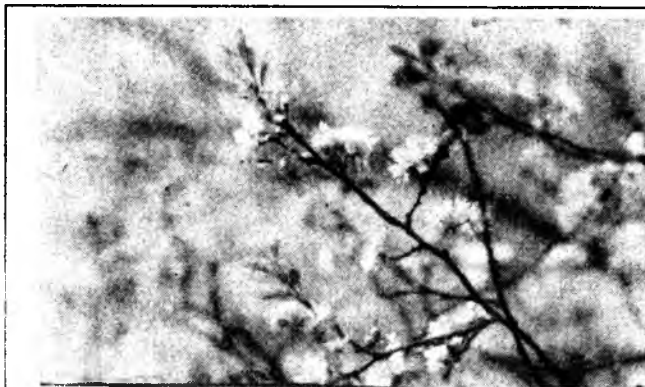
Весна, квіти, надії...

Можливо, багатьох вразить незвичайна мова його картин, де переважають чітка лінія і чистий, «відкритий» колір. Та для нас важливо відчуття змісту картин, викладений мовою живопису. Цей зміст виявляється через досконалу техніку письма і своєрідність естетичних позицій митця. З філософської точки зору його